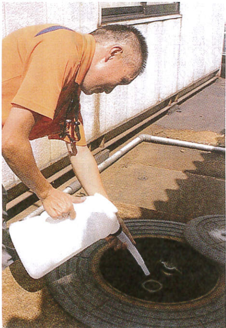
▲〔写真上〕(株)渡辺ドライ浜谷工場(新潟市)。〔写真下〕給油時、重油タンクに適量を添加するだけ